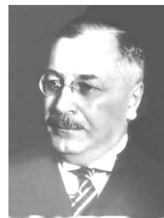
Dimitrie Gusti (1880-1955)

Sociologia este disciplina științifică ce studiază colectivitățile și comunitățile umane cu structurile și instituțiile lor, cu funcțiile și valorile sociale corespunzătoare (economice, politice, juridice, morale, religioase, culturale, filosofice etc.), precum și conexiunile dintre ceea ce societatea face din noi și ceea ce facem noi din societate.