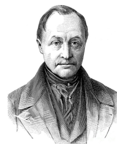
Auguste Comte (1798-1857)

Sociologia, dincolo de caracterul său științific, ne poate fi apropiată fiecăruia dintre noi. Abandonând propriul nostru punct de vedere, putem regăsi o perspectivă mult mai largă, într-un fel o nouă conștiință de sine sau o aprofundare a acesteia. Sociologia nu este doar o sumă de abstracții cărora nu le putem recunoaște în nici un fel finalitatea practică, ci o sumă de posibilități de a trăi conștienți de caracterul nostru de ființe sociale.